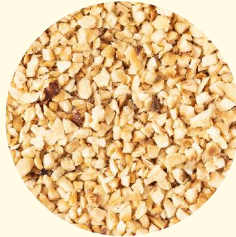
Granella nocc giffoni igp