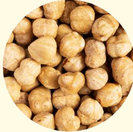
Nocciola tostata giffoni