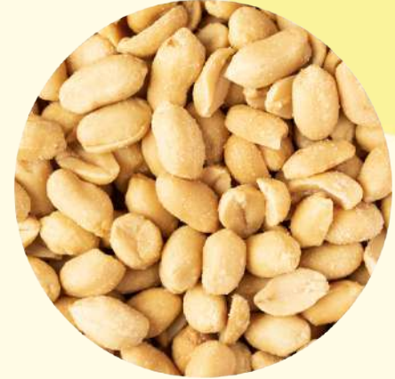
Arachidi tostate/salate 2° scelta Argentina