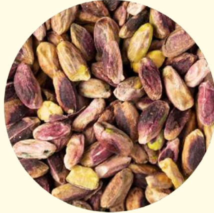
Pistacchio sgusciato/ tostato Bronte Dop