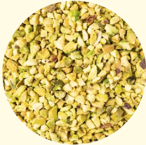
Granella pist Bronte DOP