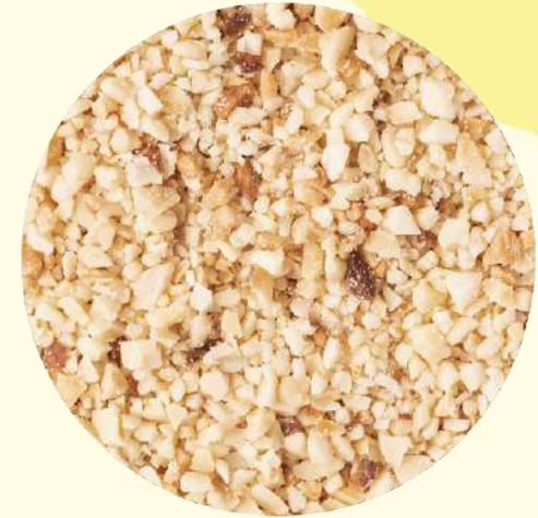
Granella arachidi elite